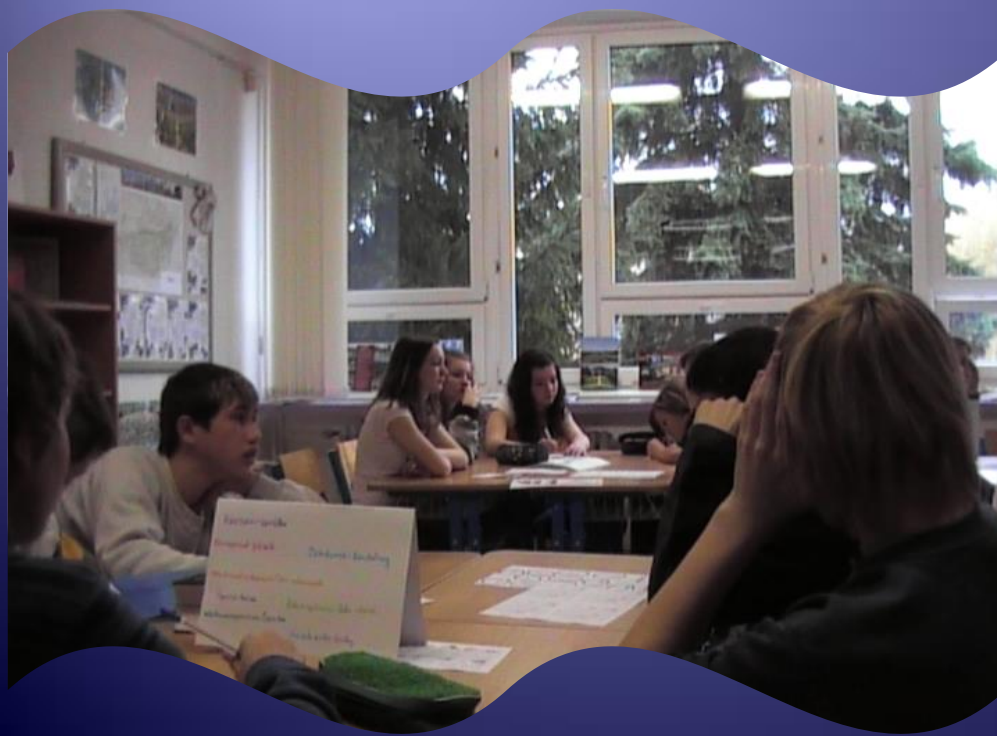
DÍLNA NĚMECKO ZEMĚPIS