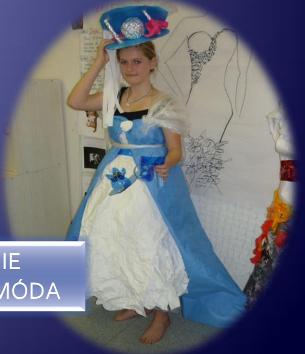
DÍLNA VELKÁ BRITÁNIE VÝTVARNÉ ČINNOSTI A MÓDA