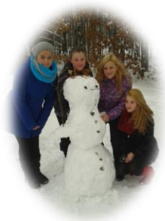
Devátáci skládají zkoušku ze stavění sněhuláka...