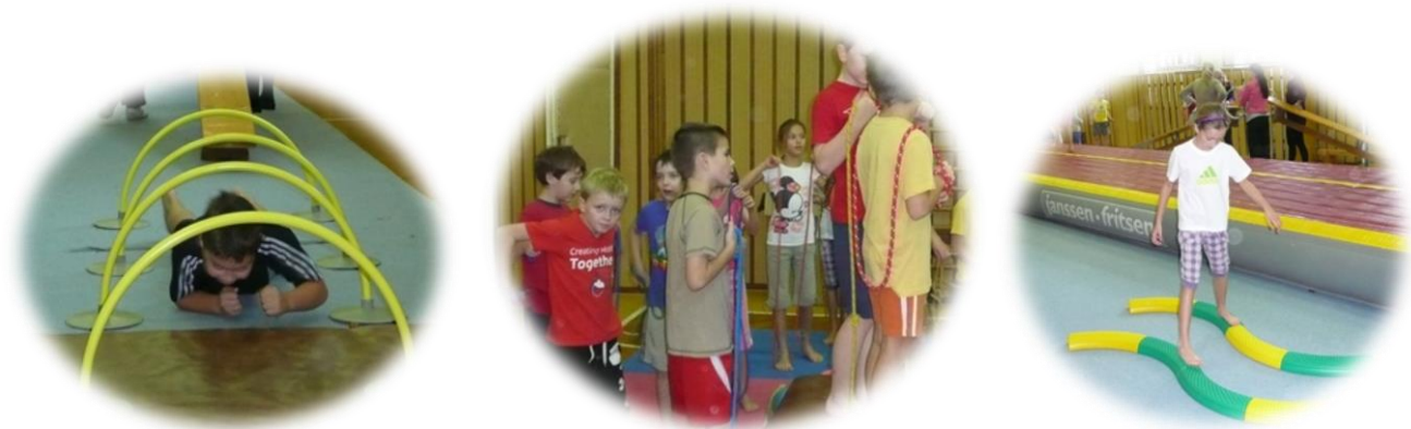
Airtrack na Střední pedagogické škole

V rámci výchovy ke zdravému životnímu stylu a prevence sociálně-patologických jevů organizuje škola řadu akcí ve spolupráci se Střediskem výchovné péče, Městskou policií, Policií ČR, Hasičským záchranným sborem, Knihovnou Kroměřížska a Muzeem Kroměřížska.